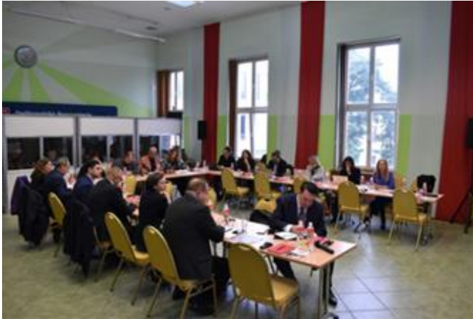
Επίσκεψη MLP στην Πολωνία (Βαρσοβία) αφιερωμένη στην ένταξη των Ουκρανών προσφύγων.

Η ιταλική πιλοτική δράση ήταν μια συνέργεια μεταξύ ενώσεων, συνδικάτων, δήμων, φορέων και εταιρειών και περιλάμβανε μαθήματα κατάρτισης για την εργασιακή ένταξη και την τοποθέτηση σε θέση εργασίας προσφύγων και αιτούντων άσυλο στο Μιλάνο και στην περιοχή Φριούλι. Ένα άλλο βασικό μέρος του έργου ήταν τα Προγράμματα Αμοιβαίας Μάθησης (MLP) με επισκέψεις ανταλλαγής μεταξύ των φορέων των εταιριών στην Ιταλία (Μιλάνο-Πορντενόε-Τεργέστη), Ελλάδα (Αθήνα) και Σλοβενία (Λουμπλιάνα).